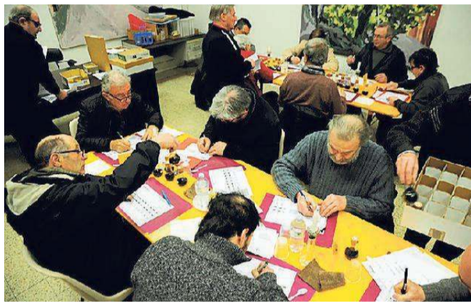
Un momento degli assaggi del nocino con il Matraccio

L'associazione fondata nel 2005 tra scuola e tradizione «Prima si guarda con una candela, poi odore e gusto»