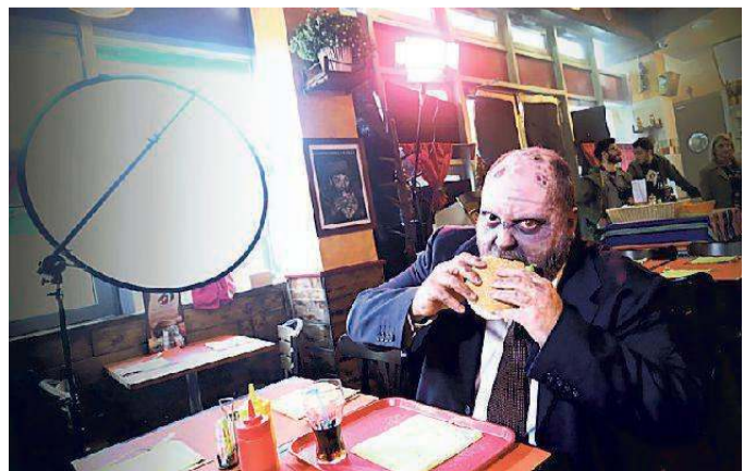
Una scena dal set della serie Rudi

Successo per la puntata pilota della serie dove il protagonista è un ex zombie