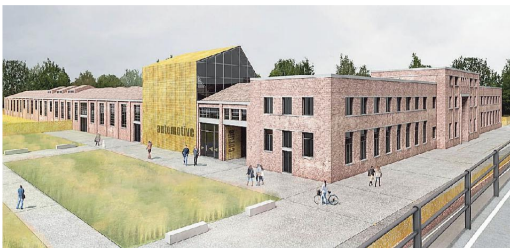
Lo stato del cantiere alle Fonderie e due rendering che mostrano come sarà il Parco Automotive

da parte di Comune e Fondazione di Modena. L'iniziativa viene sviluppata nell'ambito del programma strategico per la rigenerazione del comparto delle ex Fonderie riunite ed è caratterizzato da diversi stralci di interventi che, anche con la collaborazione dell'Università di Modena e Reggio, consentiranno la realizzazione del Distretto per l'Accelerazione e lo Sviluppo della Tecnologia (Dast), dedicato all'innovazione nel campo delle tecnologie del settore Automotive e, più in generale, per la mobilità sostenibile, con opportunità per lo sviluppo di startup.